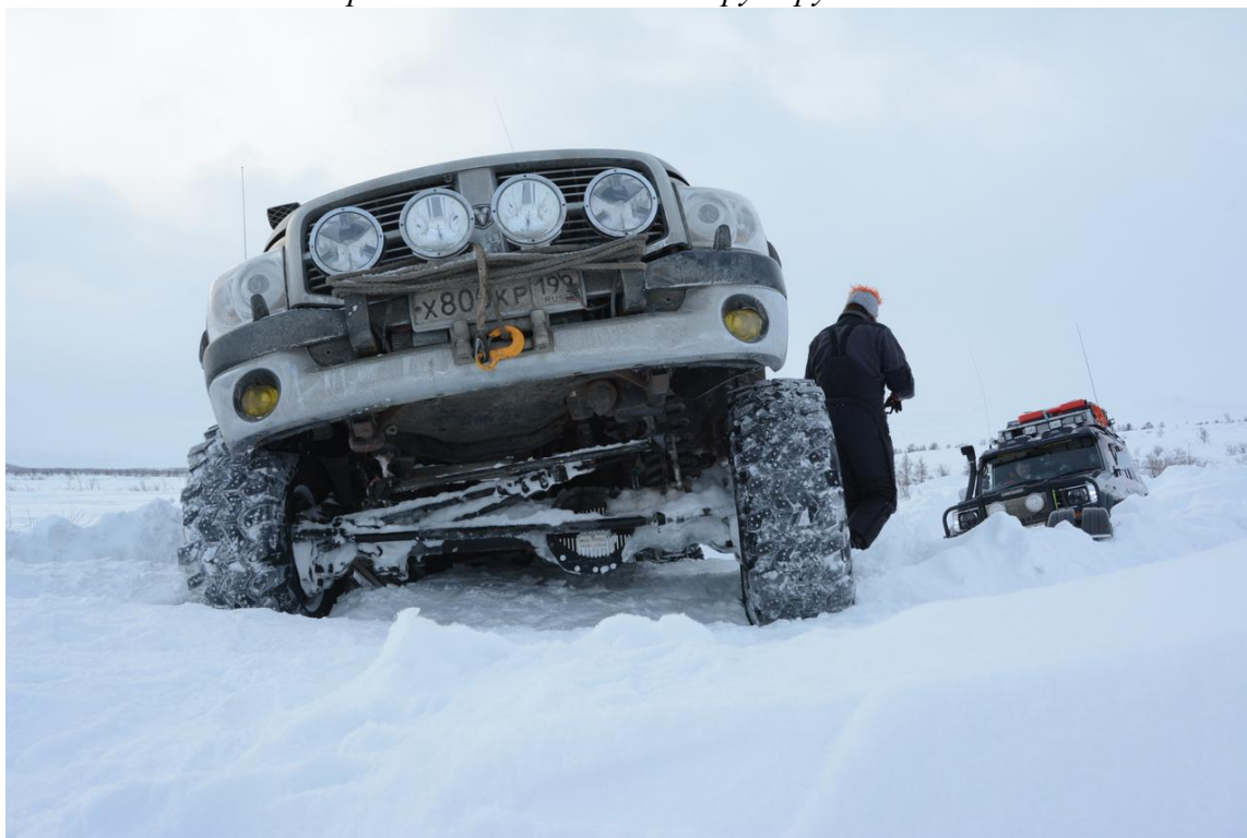
Фото № 5 Преодоление переметов

«Утром напугавший нас поворот с трехметровыми перемётами прошли часа за полтора, срывая въезды и заезды на перемёты и подтаскивая друга друга лебёдками.»